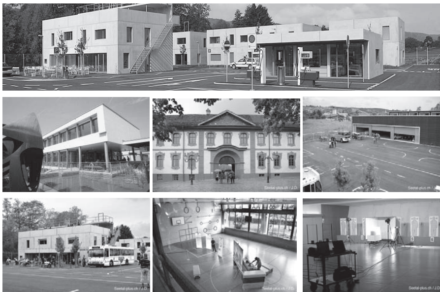
Слика 2. Међукантонална полицијска школа Hitzkirch

Од укупно 26 швајцарских кантона, ова школа по заједничком плану и програму образује кадрове за конкордат од 11 кантона, и то: